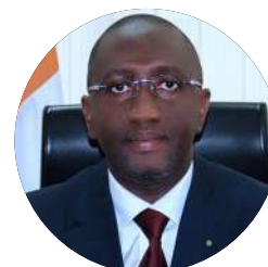
M. Souleymane DIARRASSOUBA Ministre du Commerce, de l'Industrie et de la Promotion des PME