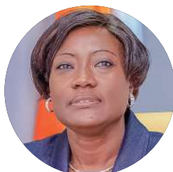
Prof. Mariatou KONÉ Ministre de l'Éducation Nationale et de l'Alphabétisation