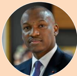
M. Mamadou TOURÉ Ministre de la Promotion de la Jeunesse, de l'Insertion Professionnelle et du Service Civique, Porte-parole Adjoint du Gouvernement