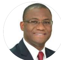
M. Sidi Tiémoko TOURÉ Ministre des Ressources Animales et Halieutiques