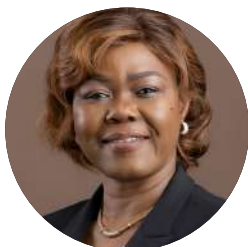
Mme Nialé KABA Ministre du Plan et du Développement