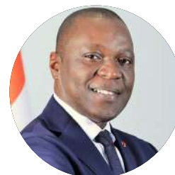
M. Amadou KONÉ Ministre des Transports