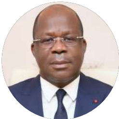
M. Pierre DIMBA Ministre de la Santé, de l'Hygiène Publique et de la Couverture Maladie Universelle