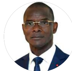
Gal. Vagondo DIOMANDÉ Ministre de l'Intérieur et de la Sécurité