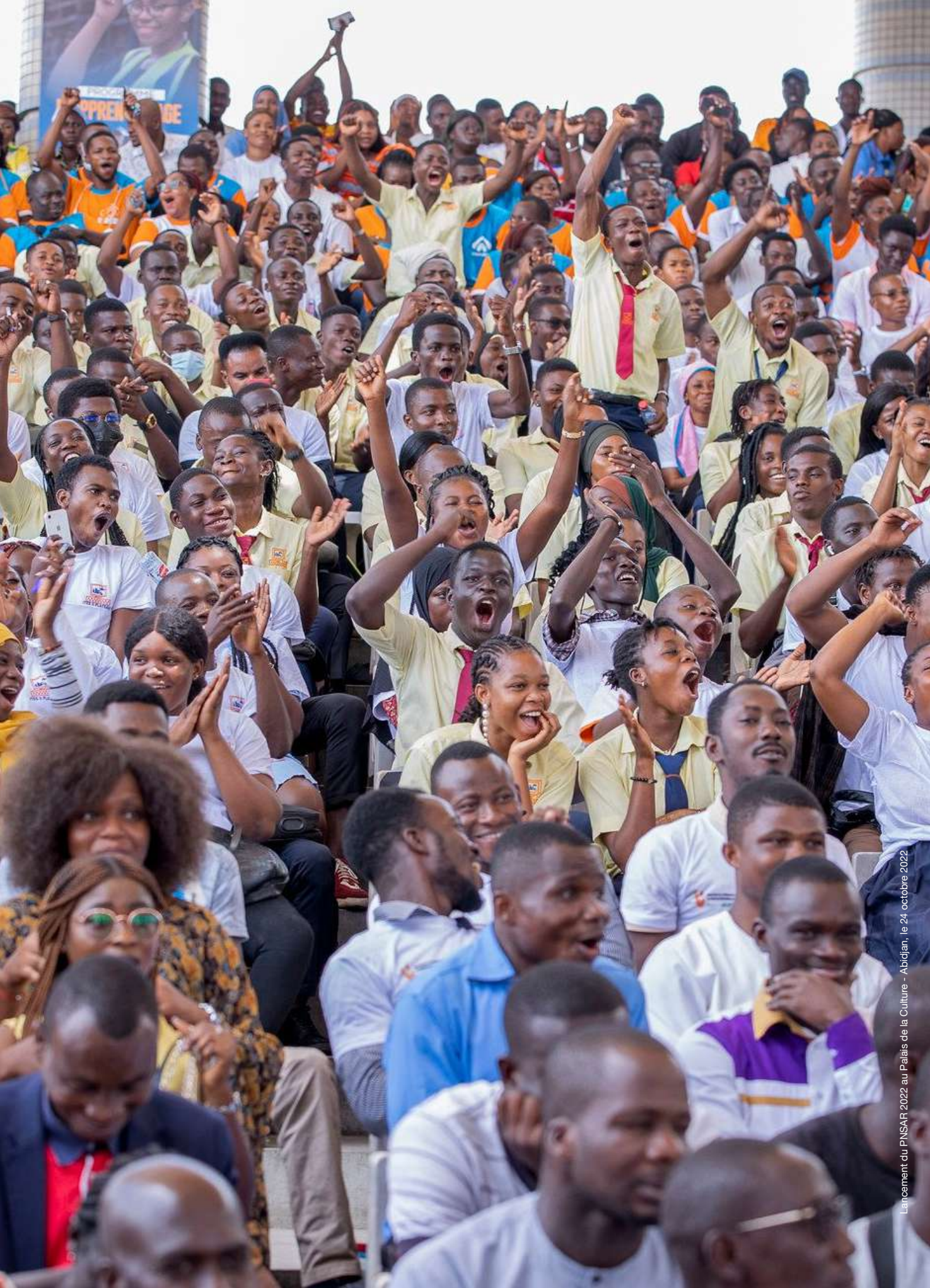
Lancement du PNSAR 2022 au Palais de la Culture - Abidjan, le 24 octobre 2022